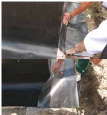
4. Ecken ausbilden

Immer im Eckbereich beginnen. Dem Eckbereich besondere Aufmerksamkeit widmen.