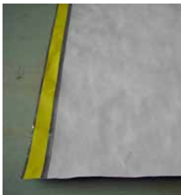
1. Auf Maß ablängen

btf-FLEXIBEL auf besenreinem Untergrund ausrollen, auf das richtige Maß ablängen und ausrichten.