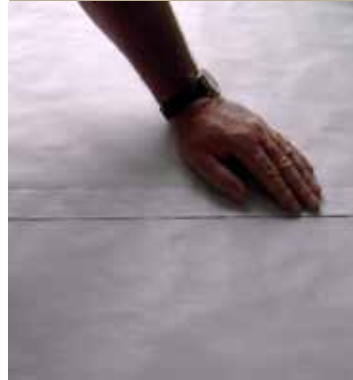
5. Fertige Naht

Anschließend die beiden Schutzfolien langsam abziehen und gleichzeitig mit der flachen Hand andrücken