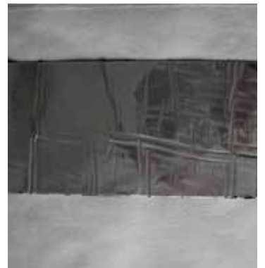
9. Ohne Schweißen

btF-SYSTEM-Anschlussstreifen auf das richtige Maß ablängen und mit Schutzfolie mittig über die Schnittstelle bzw. Anschlussstelle legen. Schutzfolie ca. 5cm abziehen und andrücken. Anschließend das Schutzpapier langsam nach hinten abziehen und mit einem Hartroller (Hartplastik oder Metallwalze) anrollen.